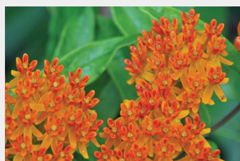
Цветущий в середине лета ваточник туберозовый ( Асклепиас тубероза )