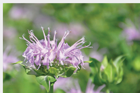
Позднецветущая монарда трубчатая ( Монарда фистулозная )

Пчелы являются одними из самых известных опылителей, но существует множество других опылителей, включая бабочек, муравьев, мух, жуков, птиц и многих других! Переноса пыльцу с одного растения на другое, опылители удобряют растения и позволяют им давать плоды или семена. Здоровье опылителей имеет решающее значение для нашей продовольственной системы и разнообразия жизни во всем мире.