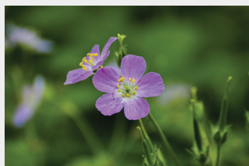
Раннецветущая дикая герань ( Герань пятнистая ) (Творческое сообщество)